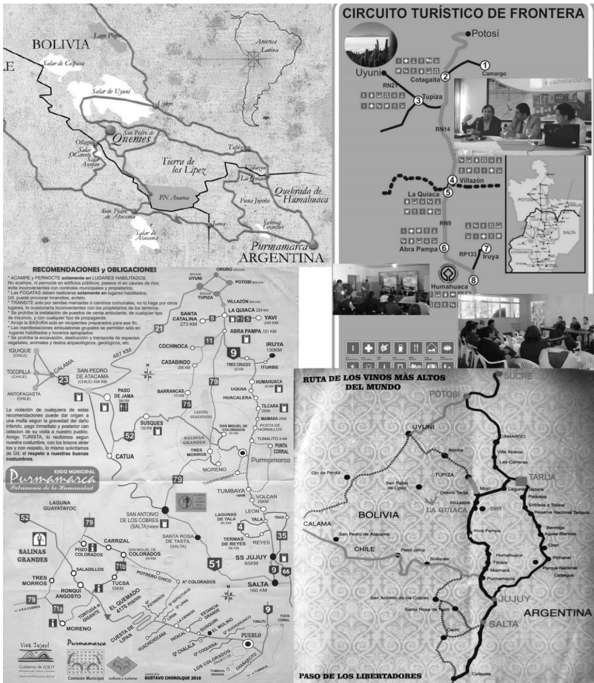
Figura 2. Cartografías turísticas de las iniciativas de integración